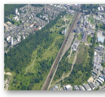
Parc d'activités La Sablonnière