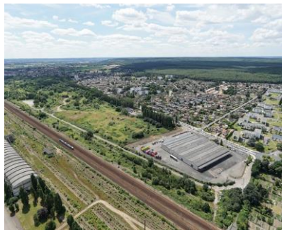
Parc d'activités La Sablonnière