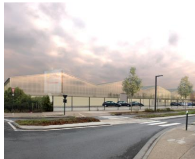
Bono Boissons – PC en cours