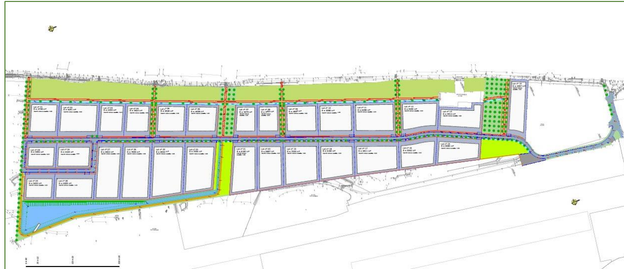
Plan masse général