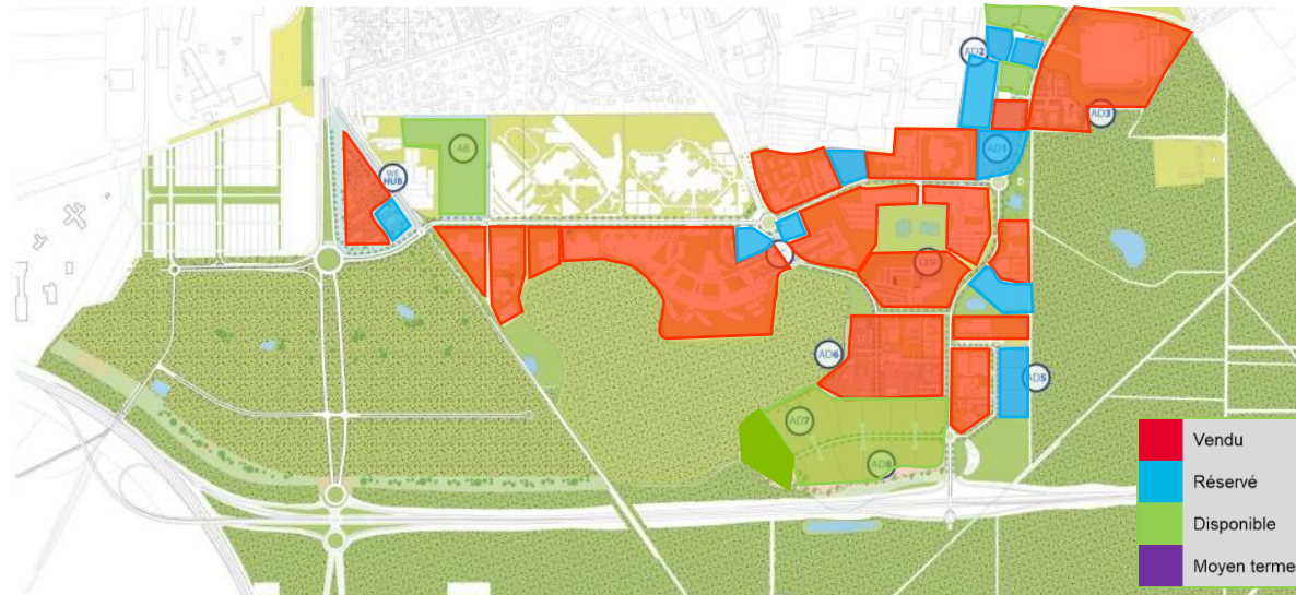
Plan masse général