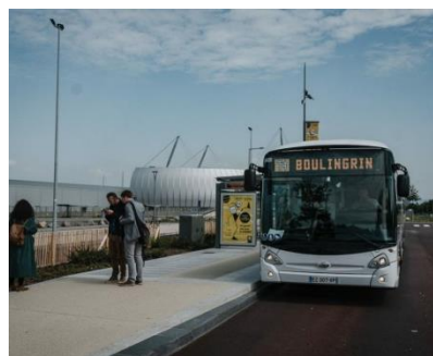
Ligne T4 desservant le parc d'activités