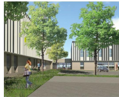
Village Activity et Mixity – Concept-Ty