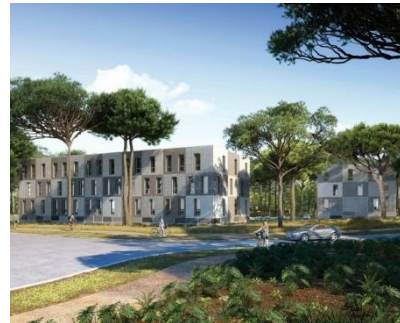
Gravitation - ASJN