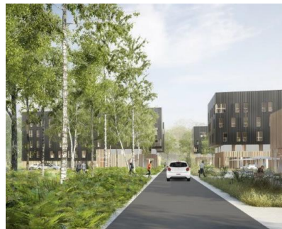
We Hub – ADIM Normandie Centre