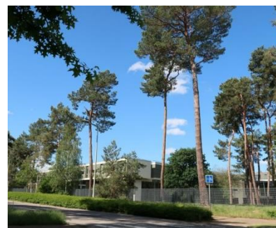
Aménagement avenue Isaac Newton