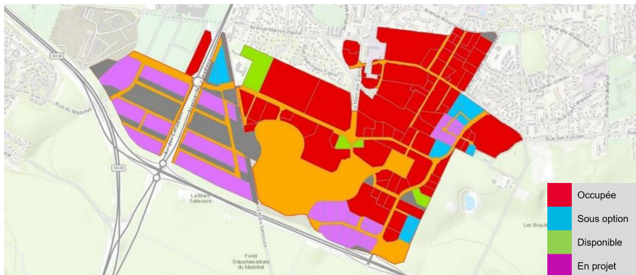
AURBSE – Observatoire des ZA @ Map data OpenStreetMap