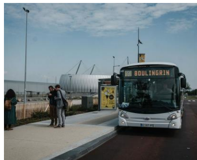
Ligne T4 desservant le parc d'activités