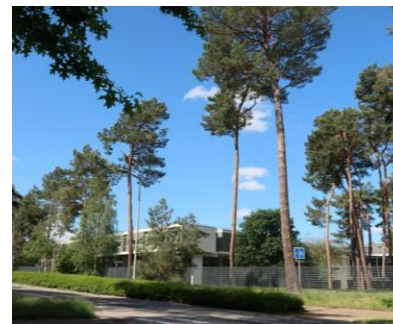
Aménagement avenue Isaac Newton