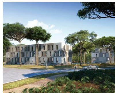
Gravitation - ASJN