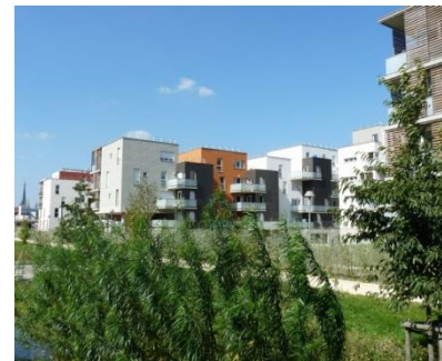
Logements de long de l'Aubette