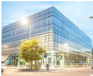
Medical Training Center