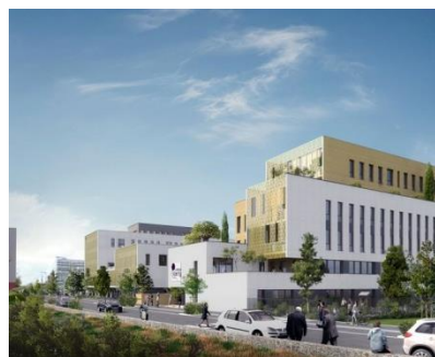
Immeuble de bureaux, crèche et centre de dialyse ANIDER – Odyssee Immobilier