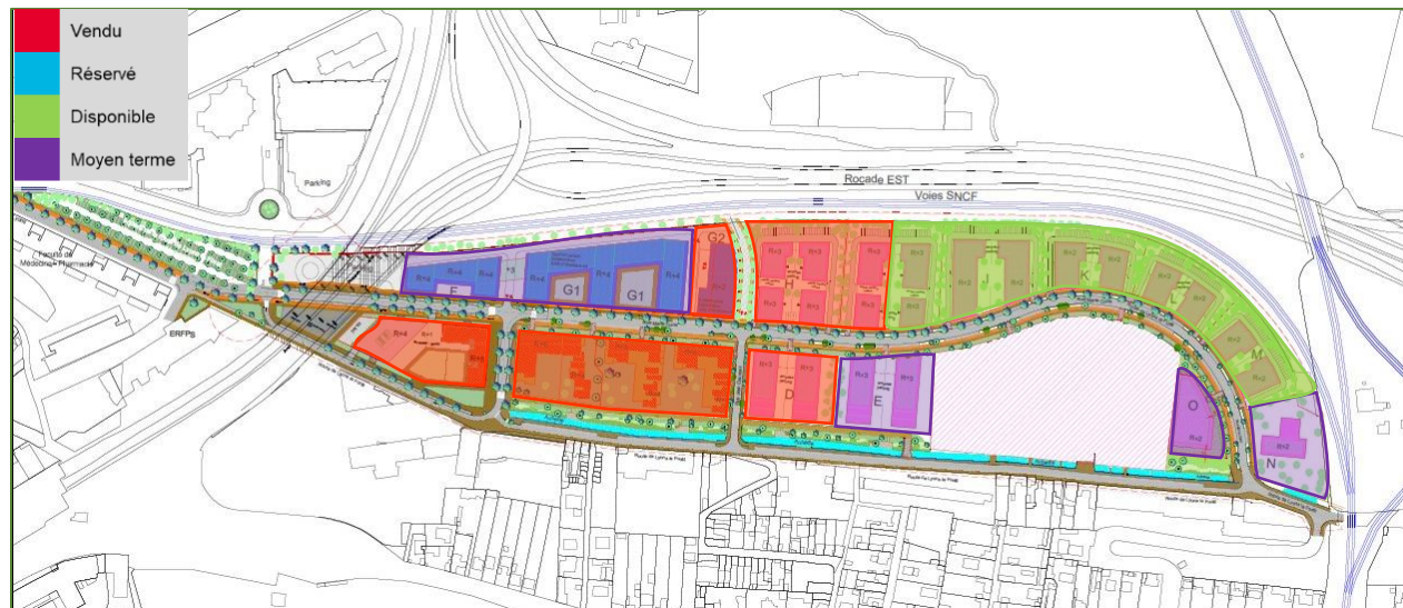
Plan masse général