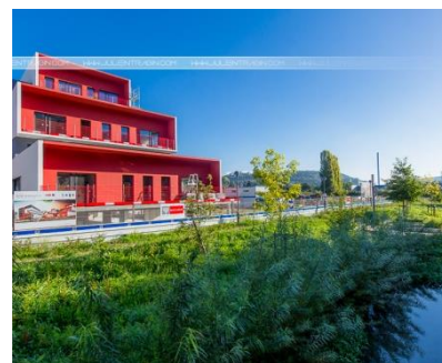
Seine Biopolis 3 – Métropole Rouen Normandie