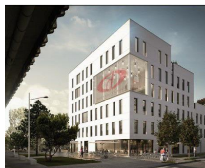
Immeuble de bureaux, résidence coliving, commerces – ADIM Normandie Centre