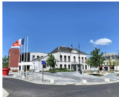
Hôtel de ville

Géoportail © FEDER Région Normandie OpenStreetMap