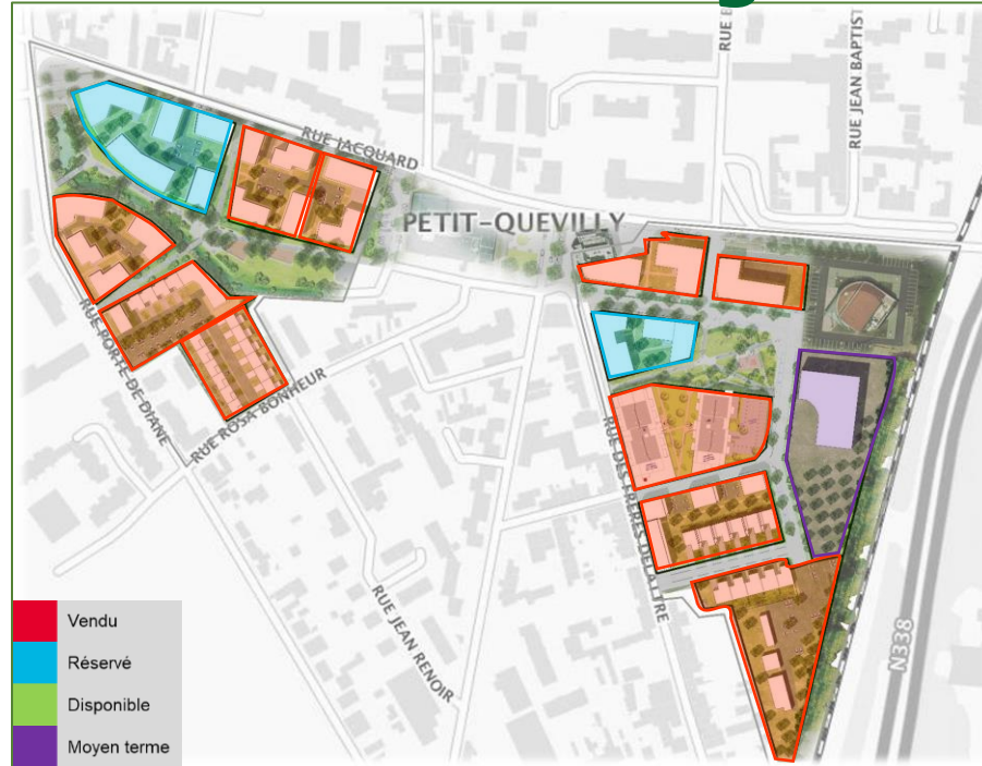
Plan masse général