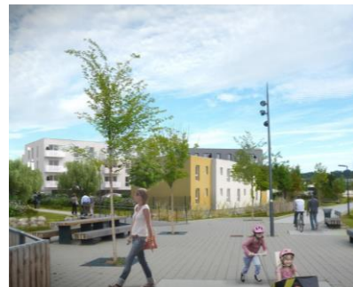
Ilots V10, 11 et 12 – Groupe Edouard Denis