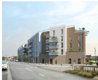
Ilot V9 – ADIM