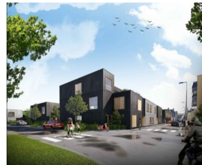
Ilots V6V7 – Eiffage Immobilier