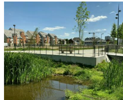
Gestion des eaux pluviales - mare