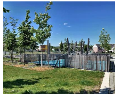
Aires de jeux