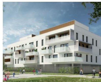
Îlot 8 – Vinci Immobilier