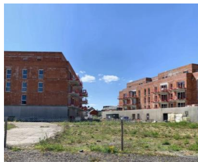
Îlot 4 – ADIM Normandie Centre