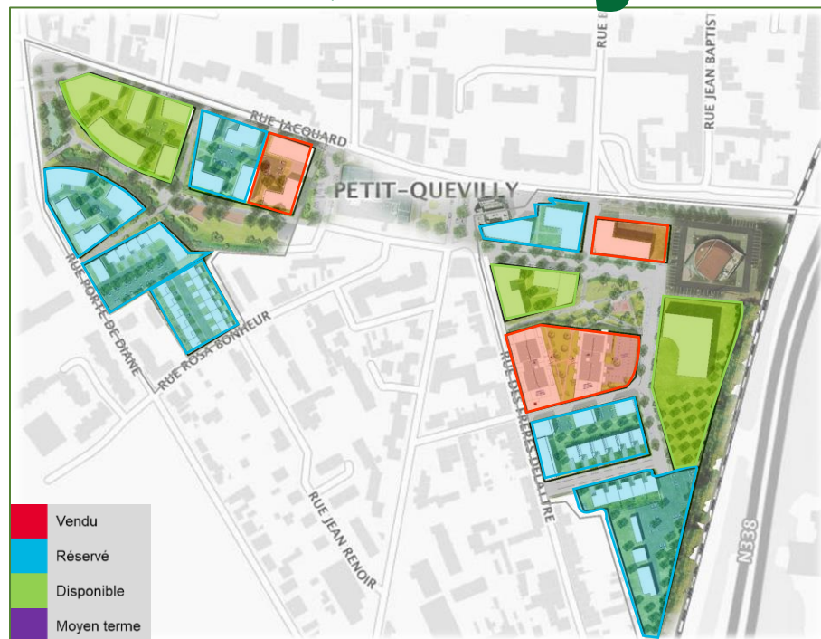
Plan masse général