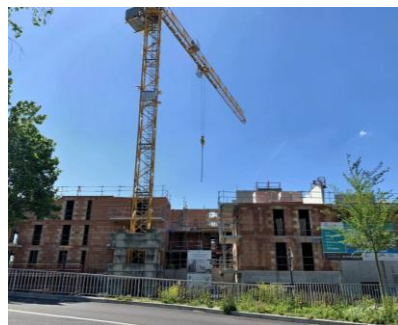
Îlot 2 – Seine Habitat