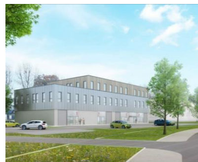
Talentis – CCI Rouen Métropole