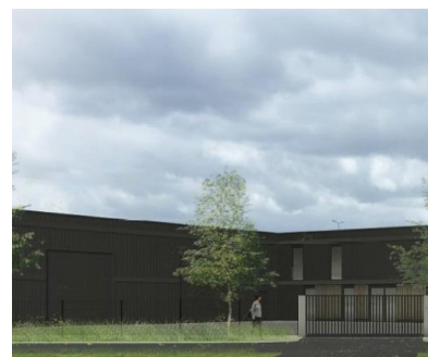
Locaux mixtes - GEPPEC